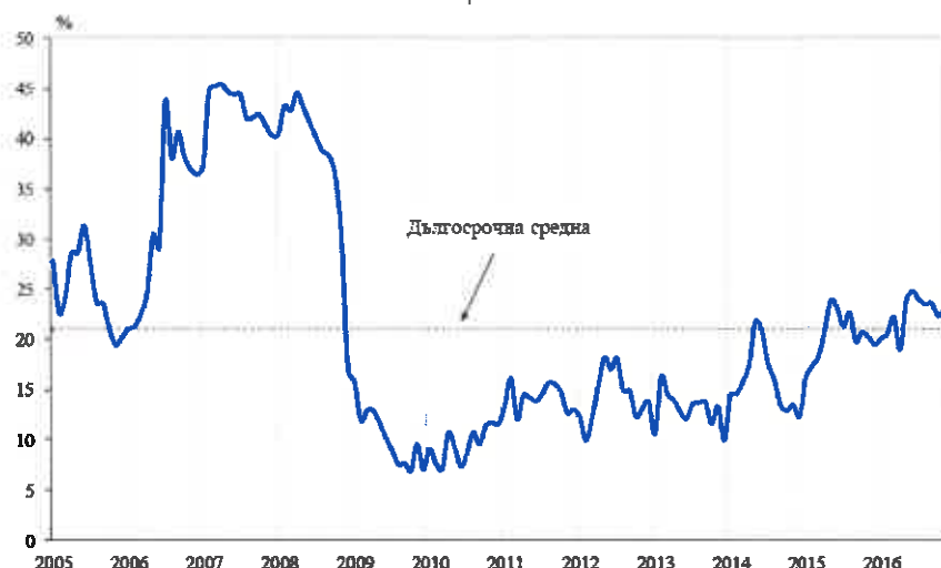
Фиг. 1. Бизнес климат - общо

Съставният показател „бизнес климат в промишлеността“ нараства с 2.3 пункта в сравнение с ноември, което се дължи на подобрените оценки и очаквания на промишлените предприемачи за бизнес състоянието на предприятията. Същевременно обаче осигуреността на производството с поръчки се оценява като леко намалена, което е съпроводено и с понижени очаквания за производствената активност през следващите три месеца.