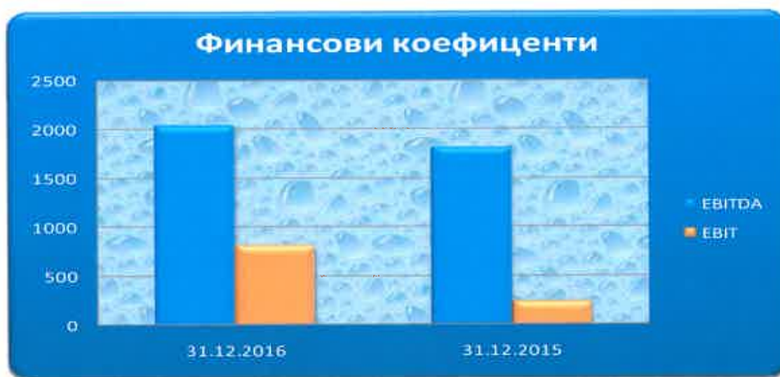
Таблица № 13