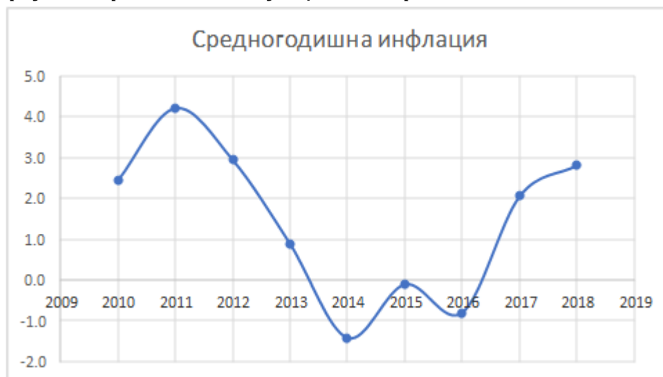
Графика 1: Средногодишна инфлация в България

Това е риск свързан с вероятността от намаление на покупателната сила на местната валута и съответно от повишение на общото ценово равнище в страната. Инфлацията намалява реалните доходи и се отразява в намаление на вътрешното потребление, както и в обезценка на активите, деноминирани в лева. Инфлационният риск се свързва и с вероятността съществуващата в страната инфлация да повлияе на реалната възвръщаемост на инвестициите в стопанския сектор. Безработица - високата безработица намалява покупателната способност на населението, което води до негативни последици и за бизнеса.