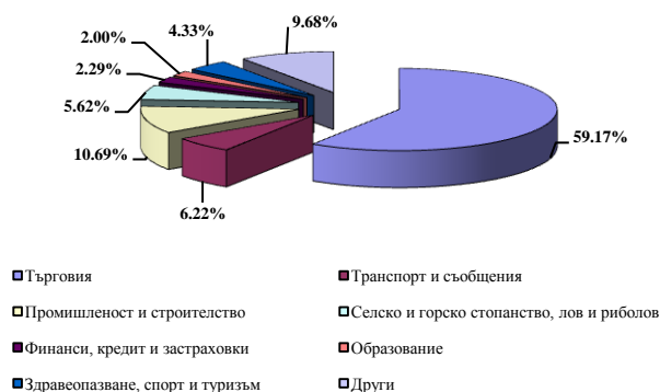
Структура на клиентите към 31.12.2012г.