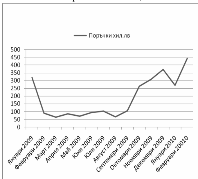
Отворени поръчки за производство към края на всеки месец

Възстановяването на пазара като тенденция ясно може да се види от отворените поръчки в изпълнение към края на всеки месец: