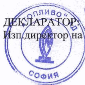
„Топливо” АД /Б.Доганян/

2. Докладът за дейността съдържа достоверен преглед на развитието и резултатите от дейността на дружеството, както и състоянието на дружеството, заедно с описание на основните рискове и несигурности, пред които е изправено.