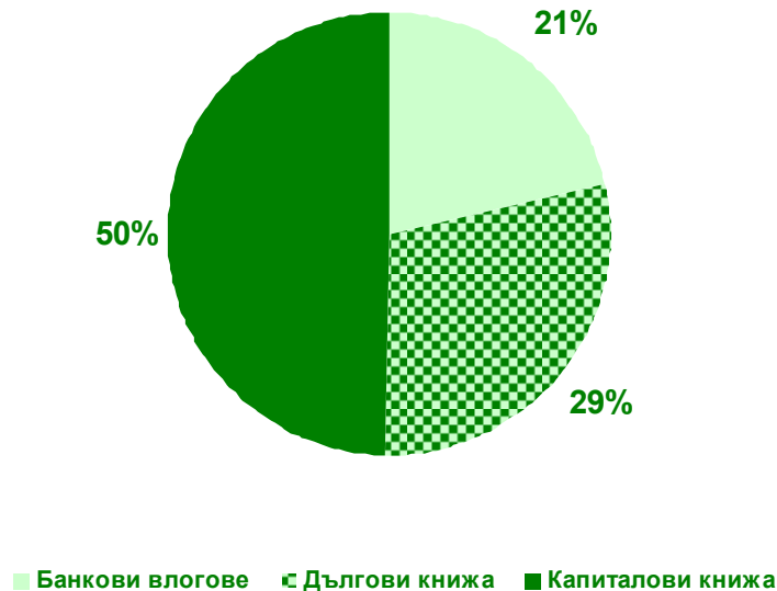
Структура на портфейла на ДСК Баланс към 31.08.2007 г.

Детайлизирана справка за структурата на портфейла на Фонда е представена в Приложение №1.