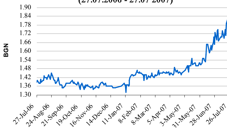
Движение акциите на ФНИБ (27.07.2006 - 27.07 2007)